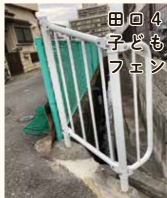
田回4丁目用水路への子どもの侵入防止用フェンスの設置