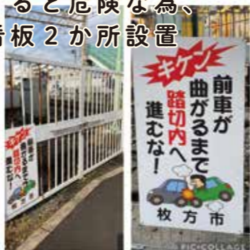
御殿山駅踏切内に前方車があり無理に侵入すると危険な為、注意喚起の看板2か所設置