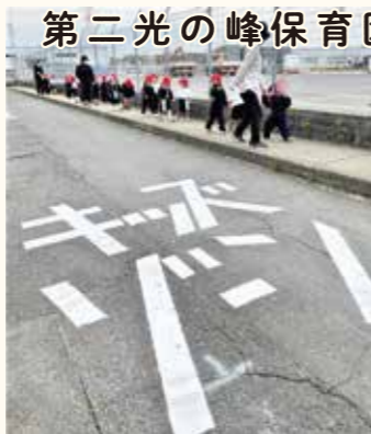
キッズゾーン設定 新たに私立光の峰保育園及び第二光の峰保育園周辺に設置