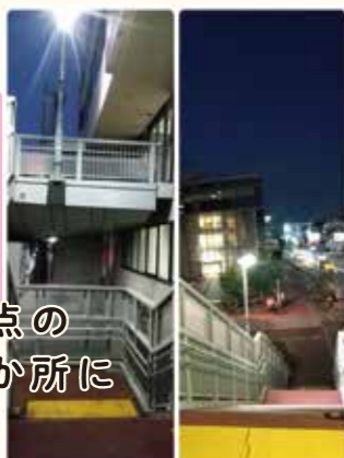
ラポール交差点の歩道橋階段2か所に道路灯を設置