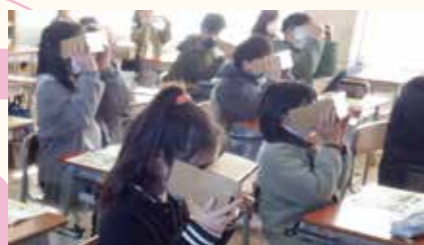
認知症体験VR学習を小学校2校にて実施 今年度小学校5校で実施予定