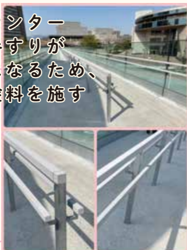
総合文化芸術センター直結の歩道橋手すりが高熱で高温になるため、耐熱性の特殊塗料を施す