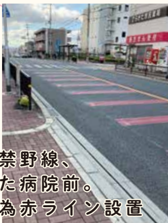
府道杉田口禁野線、市立ひらかた病院前。注意喚起の為赤ライン設置